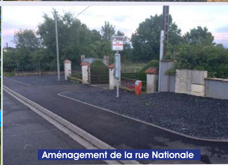
Aménagement de la rue Nationale