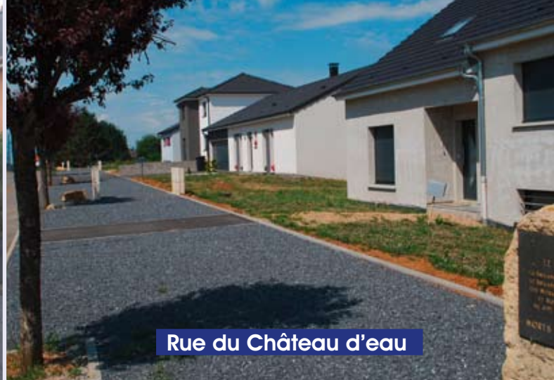
Rue du Château d'eau