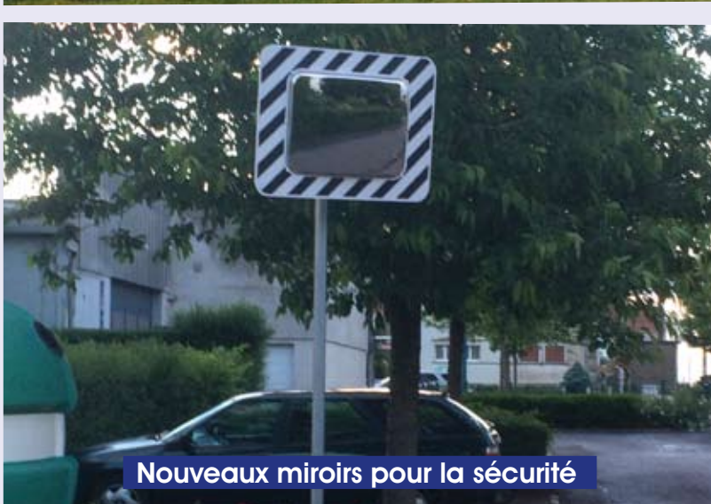
Nouveaux miroirs pour la sécurité