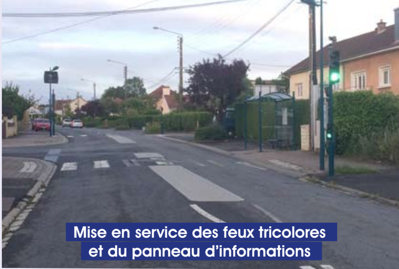
Mise en service des feux tricolores et du panneau d'informations