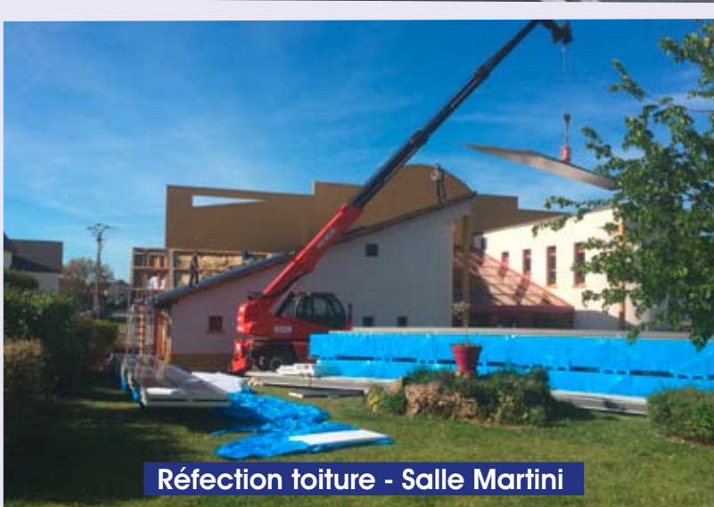
Réfection toiture - Salle Martini