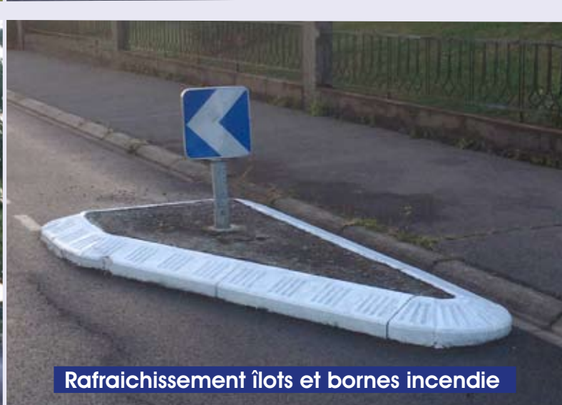
Rafraîchissement îlots et bornes incendie