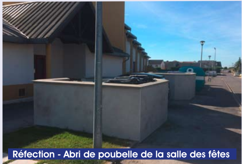
Réfection - Abri de poubelle de la salle des fêtes

Remplacement des arbres, dont la plupart étaient malades, rue de la piscine.