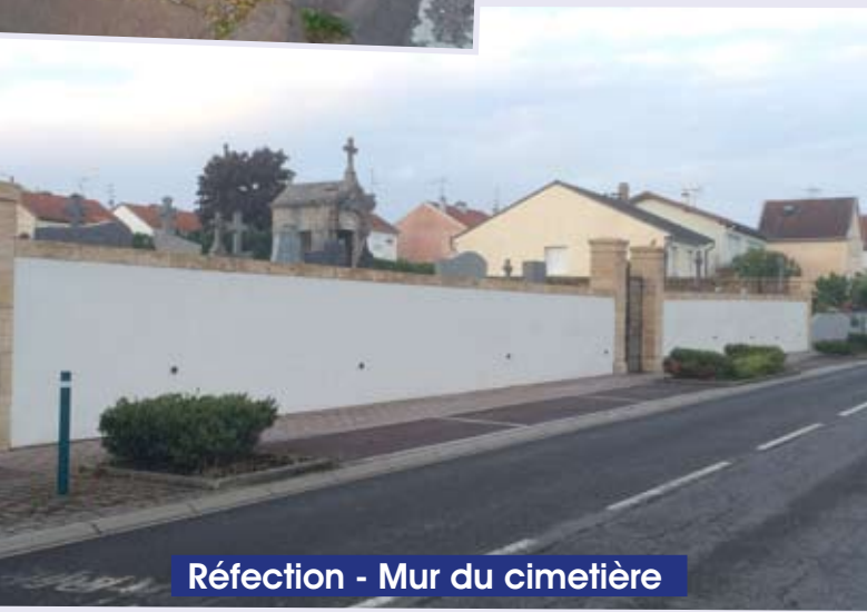
Réfection - Mur du cimetière