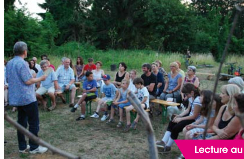
Lecture au clair de lune

Au début des vacances d'été, le sentier a accueilli la première session de "Lecture au clair de lune". Cette soirée a été une véritable réussite. Elle a permis à de nombreux visiteurs, méxéens et autres, de partager un moment convivial et agréable, lors de la lecture de textes ou de poèmes. >>>>