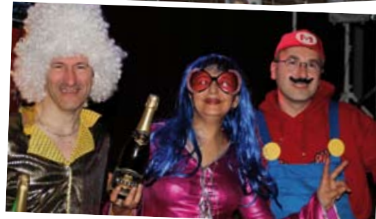
Nos 3 finalistes

Grâce au savoir-faire de notre boulangerie TERVER l'année dernière la vente des brioches avait connu un grand succès. C'est pourquoi cette année nous réitérons notre collaboration.